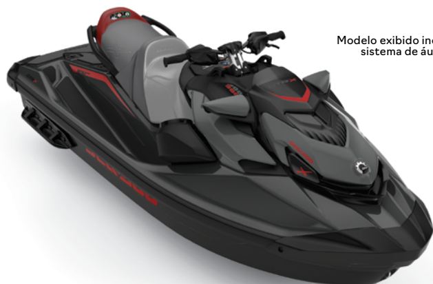
Modelo exibido inclui sistema de áudio