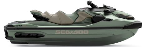
● Premium Metallic Sage