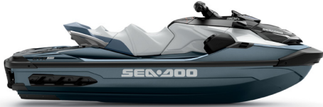
● NOVO Azul Abyss